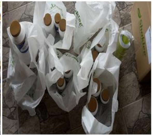
Caption : Antara produk dan pesanan yang akan di hantar oleh puan Siti Khadijah